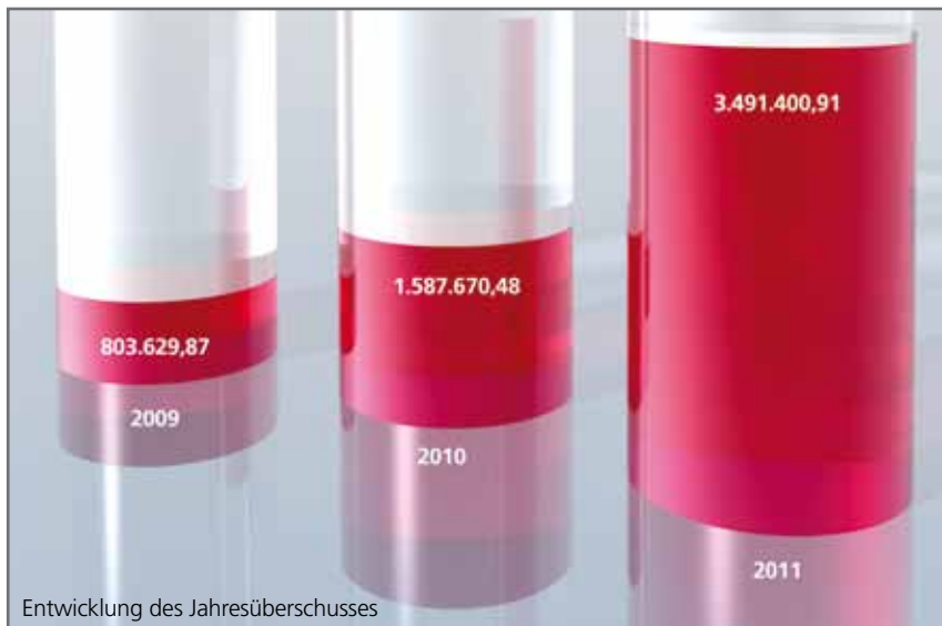
Entwicklung des Jahresüberschusses

Auf diese Weise stützt sich eine große Gemeinschaft gegenseitig – ein unschlagbarer Vorteil des Genossenschaftsgedankens, der gerade in einer älter werdenden Gesellschaft enorme Bedeutung erfährt.